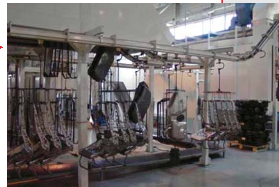
▶ Dettagli del trasporto bilancelle sedili. Detail of the seat jig handling.

CATAPHORESIS LINE FOR CAR SEATS - 125 bilancelle/h - 100 kg/cad - 6 mq/cad