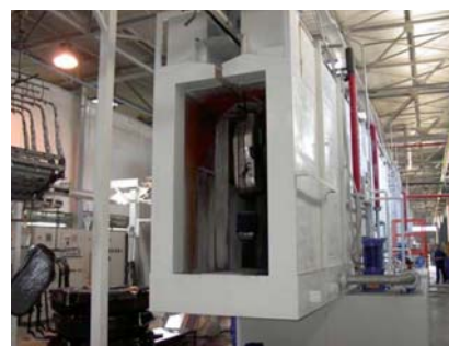
◀ Tunnel di pretrattamento. Pretreatment tunnel.