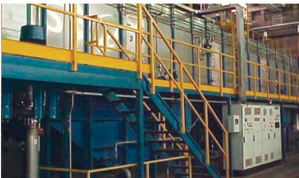
▲ Tunnel postcataforesi. Post-cataphoresis tunnel.

CATAPHORESIS LINE FOR REFRIGERATOR COMPRESSORS - 3 lines - 2.7 m/min equivalent to 10,000,000 compressors/year